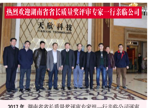
2017年,湖南省省长质量奖评审专家一行莅临公司评审