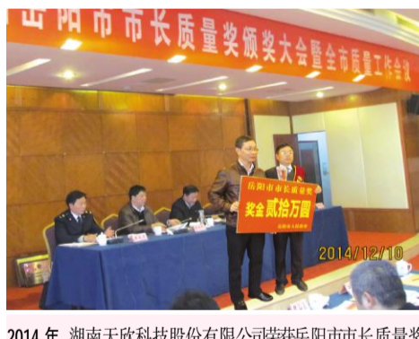
2014年,湖南天欣科技股份有限公司荣获岳阳市市长质量奖

“岳阳市市长质量奖”为岳阳市人民政府颁发的最高奖项,该奖项于2012年由市政府确定设立,主要授予实施卓越的质量管理经营模式,质量管理水平和自主创新力在同行业处于领先地位,取得显著经济效益、社会效益的企业和个人。市质监局、市人社局、市经信委、市住建局、市农业局、市安监局、市环保局、市卫计委、市食品药品监督管理局、市工商局、市财政局、岳阳检验检疫局等负责人组成评选委员会。