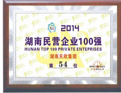
2014年,第二届民营企业100强。