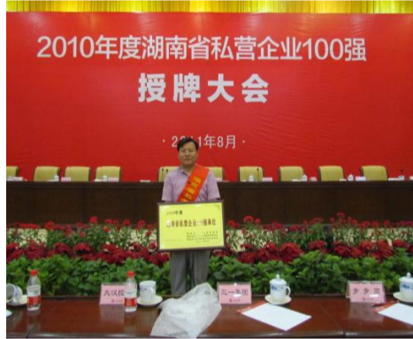
2011年,第一届民营企业100强发布现场。